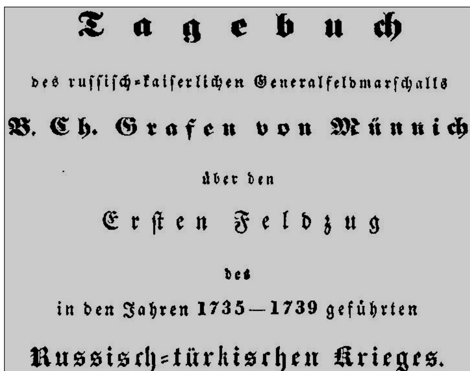
Рис. 1. Титульный лист дневника Б. Х. Миниха, опубликованного в Лейпциге в 1843 г. [22, с. 118] в виде приложения к «Истории русского государства» Е. А. Геррманна (дневник написан Г. Юнкером).

С началом в 1735 г. Русско-турецкой войны по ходатайству Б. Х. Миниха Г. Юнкер был определен историографом при фельдмаршале для ведения походного журнала. Журнал, как важный отчетный документ, посылался фельдмаршалом отдельными частями в Кабинет министров, для чего его переводили на русский язык (Г. Юнкер вел журнал на немецком языке, так как русским языком он практически не владел). Русский перевод журнала похода в Крым армии Б. Х. Миниха за 1736 г. отложился в архивных материалах Кабинета (Российский государственный архив древних актов (РГАДА), ф. 177, оп. 1, д. 9, 10а), он впервые был опубликован П. А. Аваковым в 2017 г. [5, с. 17–20, 57–107].