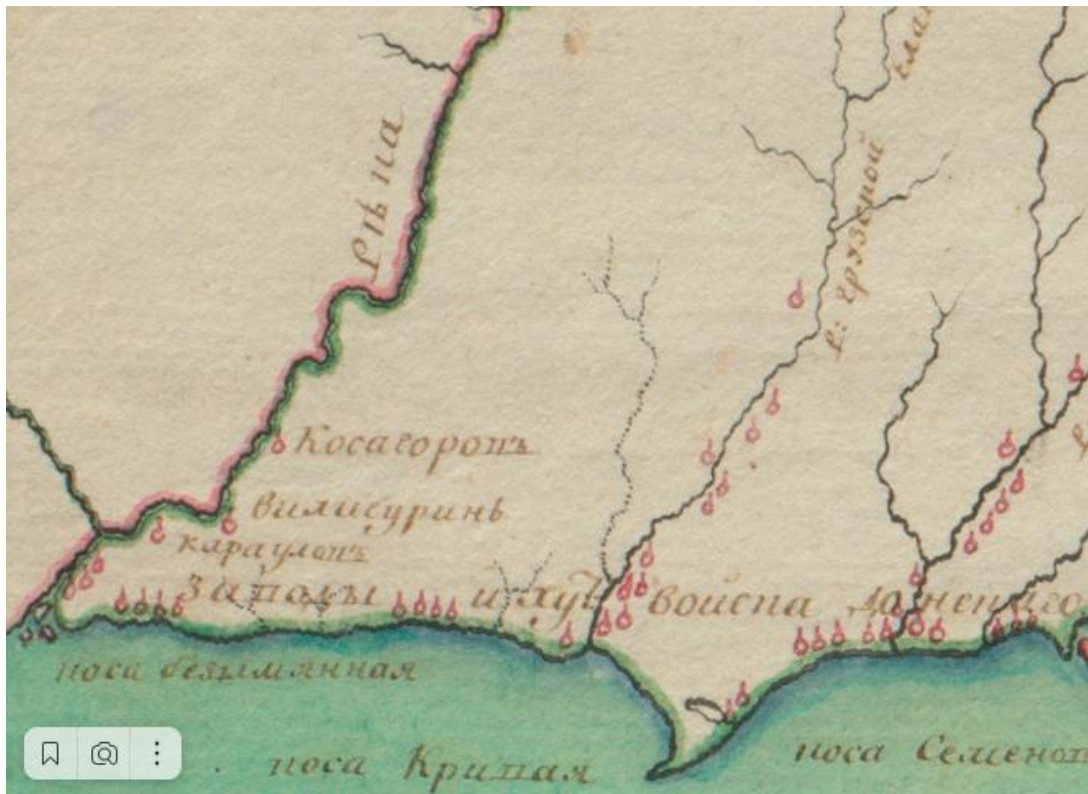
Рисунок 2. Фрагмент карты войска Донского, 1782 г. 3