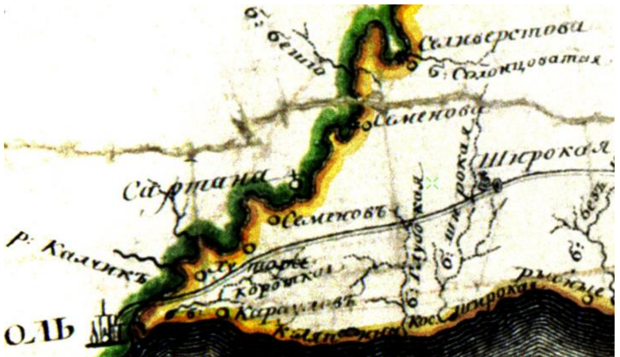
Фрагмент Генеральной карты Земли Войска Донского из атласа Теврюнникова 1797 года