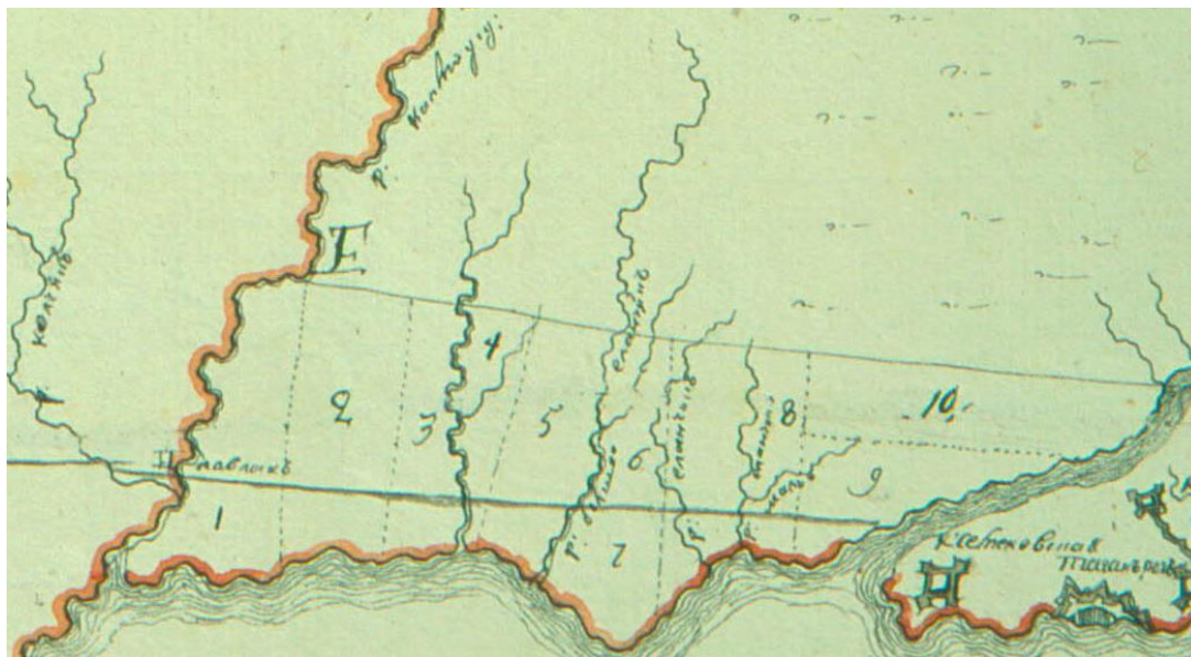
Рисунок 1. Фрагмент карты Азовской и Новороссийской губерний, сентябрь 1778 года. Северная граница барьерных земель показана здесь сплошной линией. Пунктиром – земельные участки для размещения новых селений Азовской губернии.

Чертков мечтал прирезать эту часть барьерных земель к Азовской губернии. Помимо роста доходов за счет рыбных ловель, это также позволило бы повысить связность между основной территорией губернии и Таганрогским ее «анклавом». В некоторых прожектах даже рассматривалась возможность забрать у донцов еще и полосу земель к северу от барьера для размещения здесь десяти новых селений (см.рис.11). Особенно бурно дискуссия по поводу различных спорных земель шла между князем Потемкиным и руководством подчиненных ему Азовской губернии и войска Донского в 1777 году. Но донцы были готовы пойти на значительные уступки по всем другим спорным территориям, лишь бы им оставили эту морскую полосу с ее рыбными ловлями. И, в конечном итоге, приморская полоса между Кальмиусом и Миусом была оставлена войску Донскому.