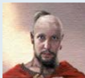
biofoton Семьянин форума 100%

Считаете мариупольский краевед может знать лучше славянских и краматорских?)