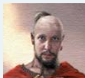
biofoton Семьянин форума Быстрый ответ