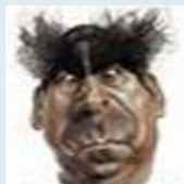
L.V. Семьянин форума Быстрый ответ

Иногда верно поставленный вопрос уже является ответом