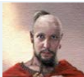
biofoton Семьянин форума 100%

Сообщения: 2566 Зарегистрирован: Ср фев 02, 2011 01:05