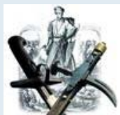
Козарлюга Семьянин форума 100%

Сообщения: 2754 Зарегистрирован: Вт янв 25, 2011 00:31