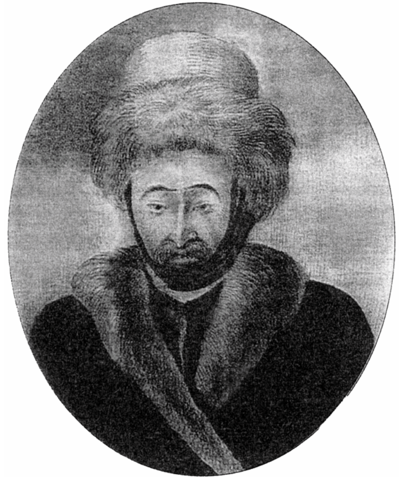
Султан Шагин-Гирей. Копия с оригинала художника А.Рослина. 1772 г.