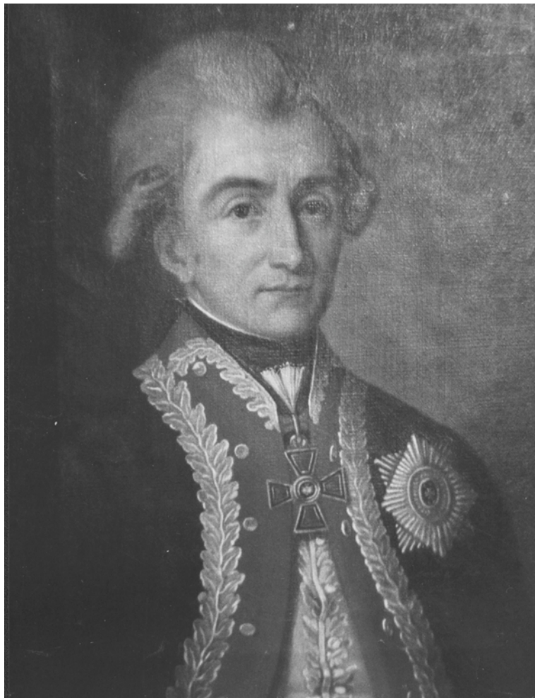
Правитель Екатеринославского наместничества, генерал-майор И.М. Синельников. Днепропетровский исторический музей