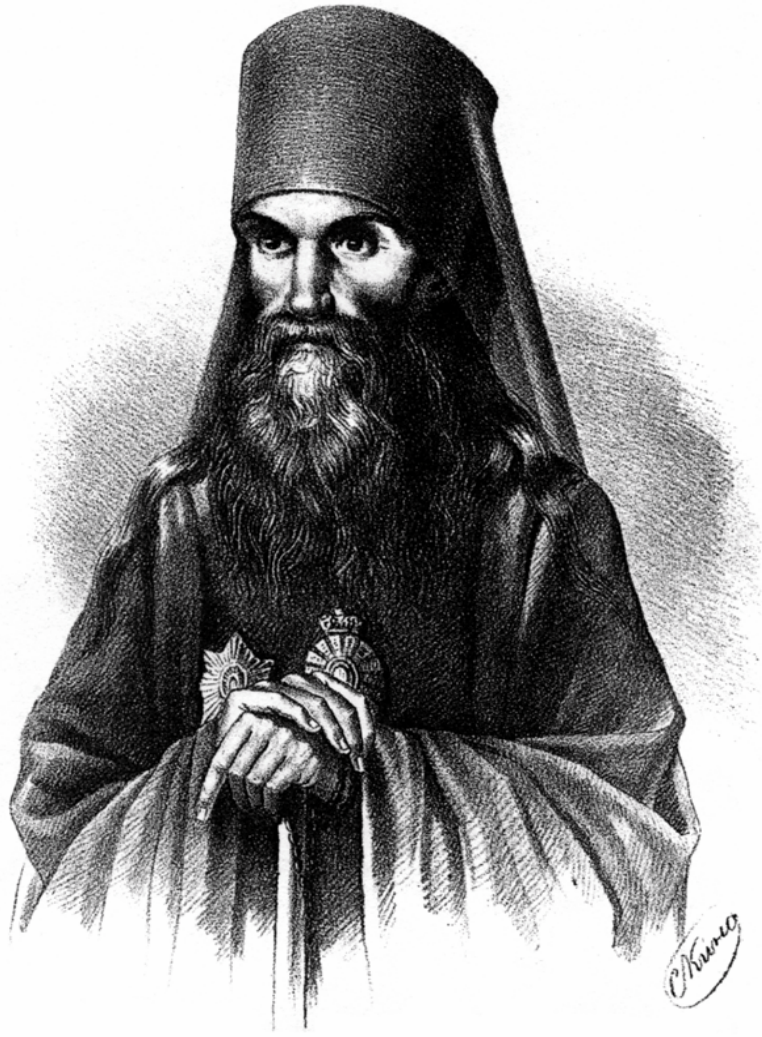
Архиепископ Иаков (Вечерков)