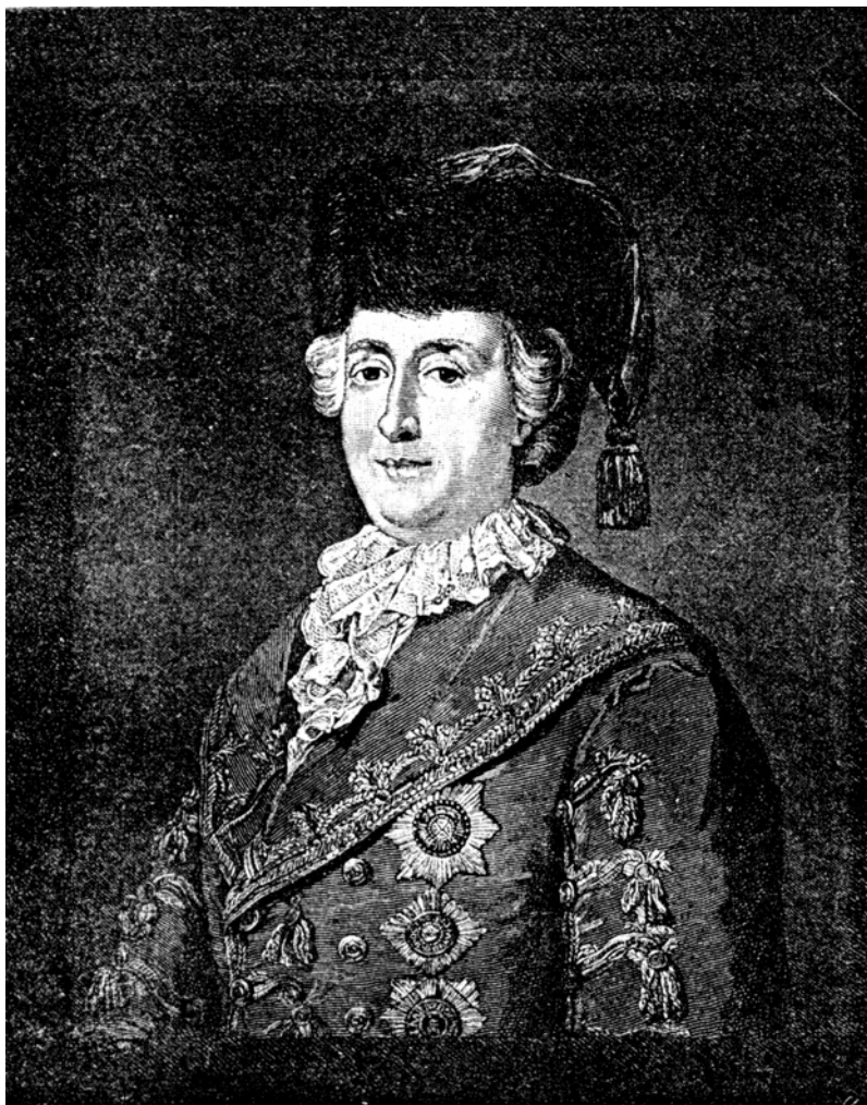
Императрица Екатерина II Алексеевна в дорожном платье, которое она носила во время путешествия в Крым, в 1787 г. Гравюра Д. Уолкера с портрета М. Шибанова