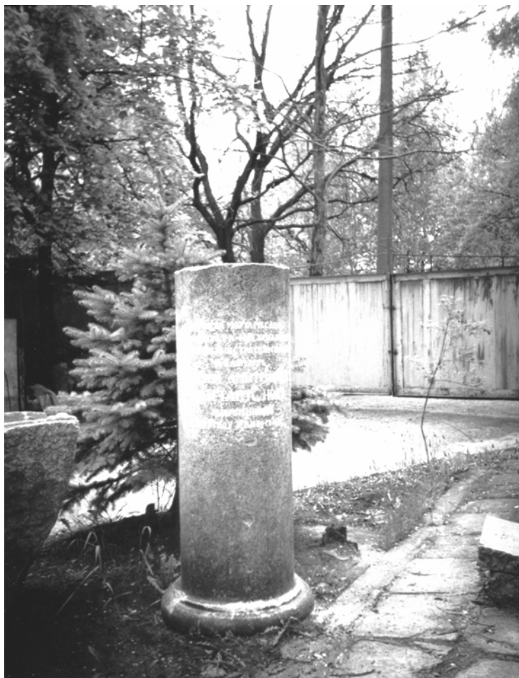
Памятник с могилы А.Д. Константинова, находящийся ныне в ограде Свято-Покровского храма в г. Орехов Запорожской области. 2006 г.