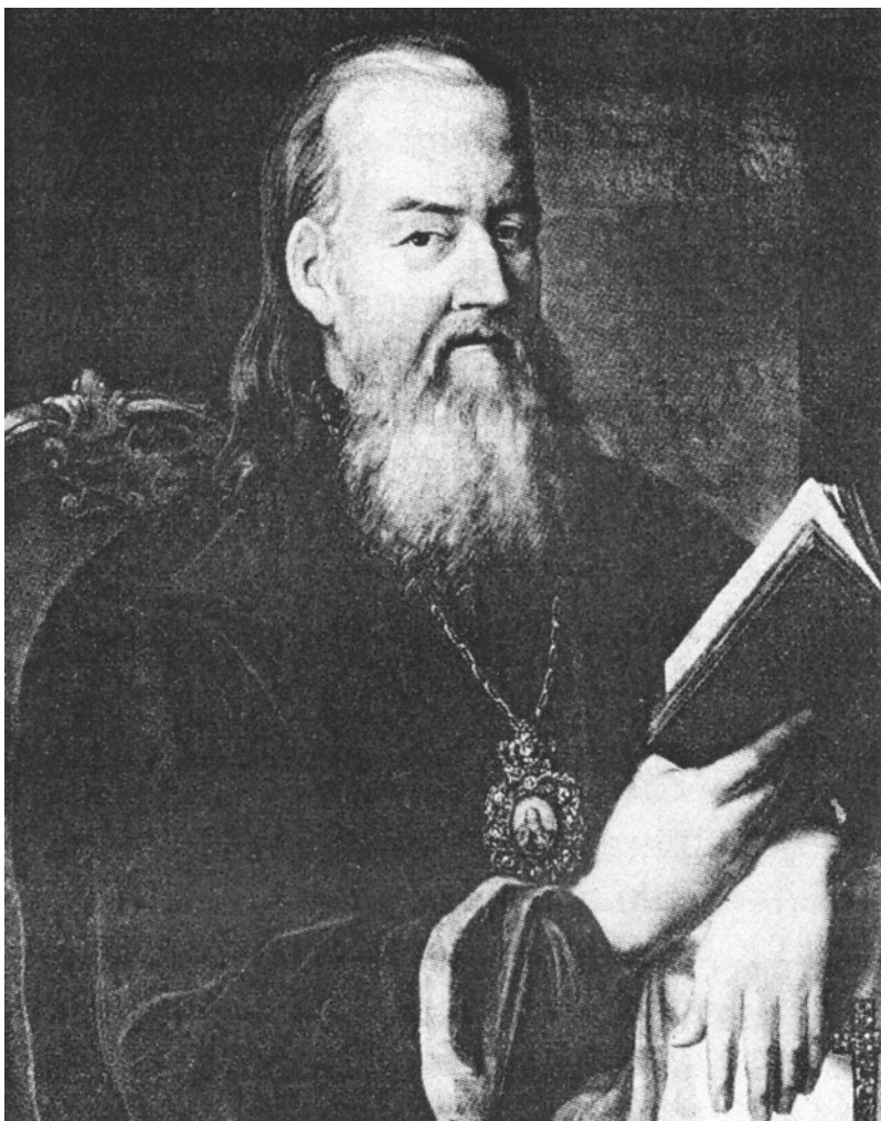
Митрополит Гавриил (Петров-Шапошников)