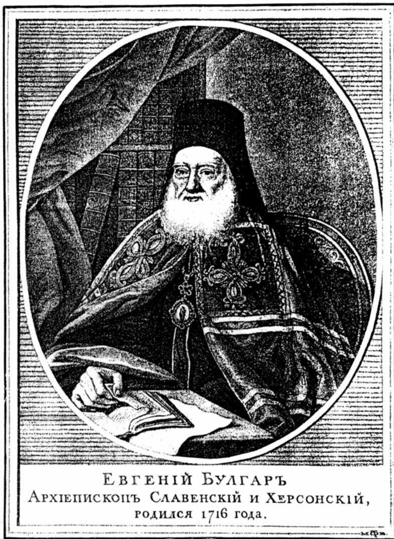
Архиепископ Евгений (Булгарис)