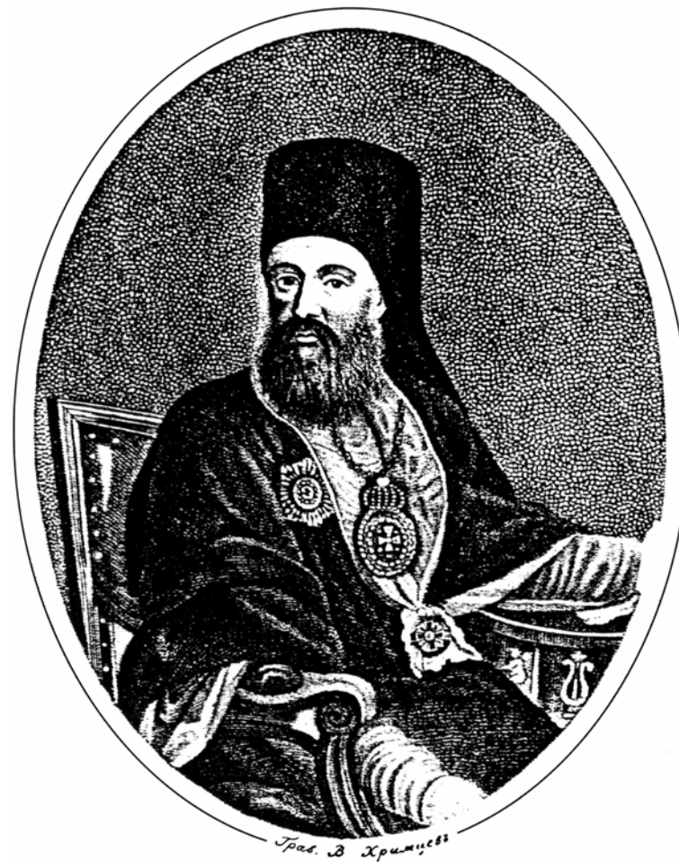
Архиепископ Никифор (Феотоки) Гравюра работы В. Храмцева