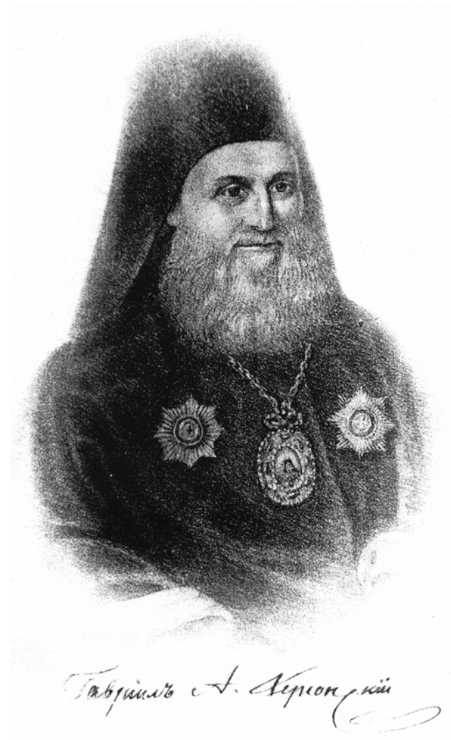
Архиепископ Гавриил (Розанов)